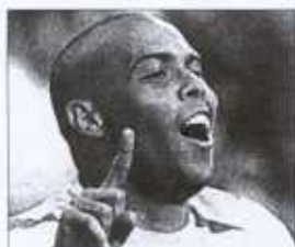
Ronaldo celebra su gol ante Turquía.

Brasil e Italia debutaron en el Mundial con sendas victorias. Italia derrotó con comodidad a Ecuador gracias a dos goles de Vieri (2-0). Brasil, por el contrario, sufrió ante Turquía (2-1). Ronaldo logró el empate en la segunda parte tras el gol inicial turco. A escasos minutos para el final, Rivaldo materializó un penalti inexistente, con el que el árbitro castigó un agarrón fuera del área. México ganó a Croacia (1-0). Páginas 44 a 54